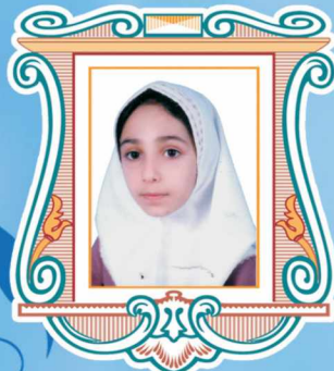
نمين السادات وكيلى ، كمر بند مشكي مقام دوم كميته